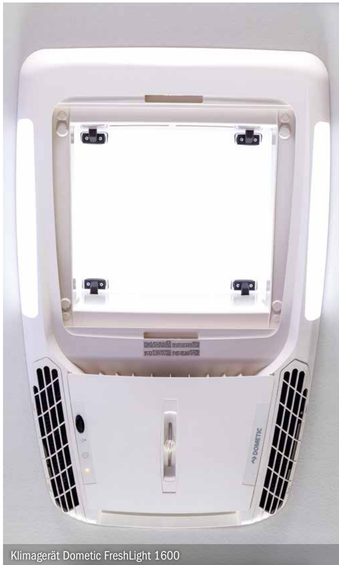
Klimagerät Dometic FreshLight 1600