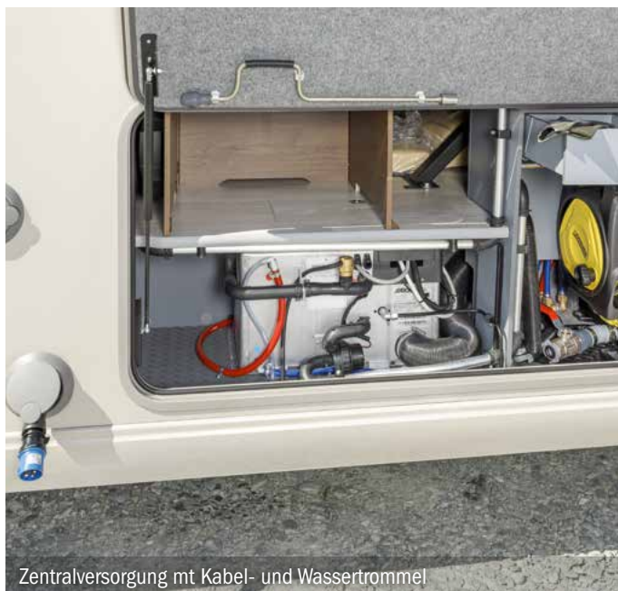
Zentralversorgung mit Kabel- und Wassertrommel