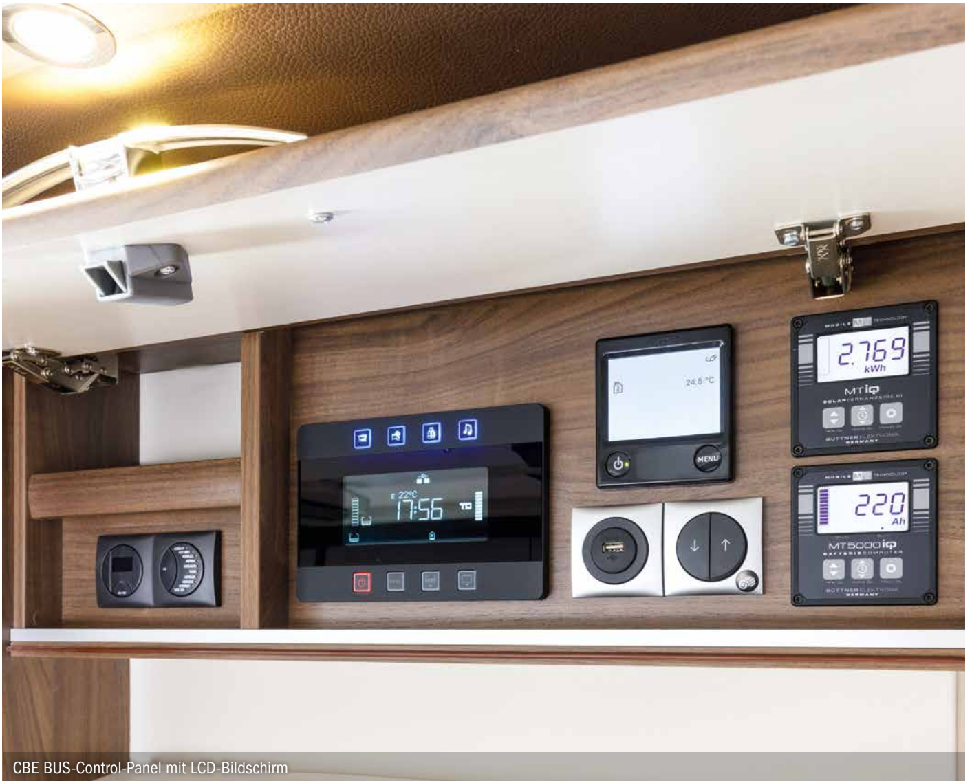
CBE BUS-Control-Panel mit LCD-Bildschirm