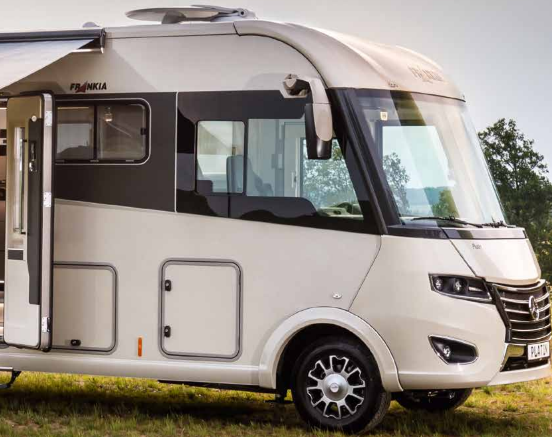
FRANKIA | 8400 QD PLATIN

Seit über 45 Jahren bauen wir FRANKIA Wohnmobile auf Mercedes-Benz und verbinden damit das Beste aus zwei Welten. Neue Entwicklungen, neue Aufbau­lösungen, neue Technik – mit jedem Modelljahr entwickeln wir FRANKIA auf dem hochwertigen Hochrahmen-Chassis von Mercedes-Benz weiter und machen ihn noch stärker. Mit der Spitzenklasse FRANKIA PLATIN auf dem neuen Sprinter von Mercedes-Benz mit traktionsstarkem Heckantrieb lassen wir jetzt den Stern in einer neuen Dimension strahlen.