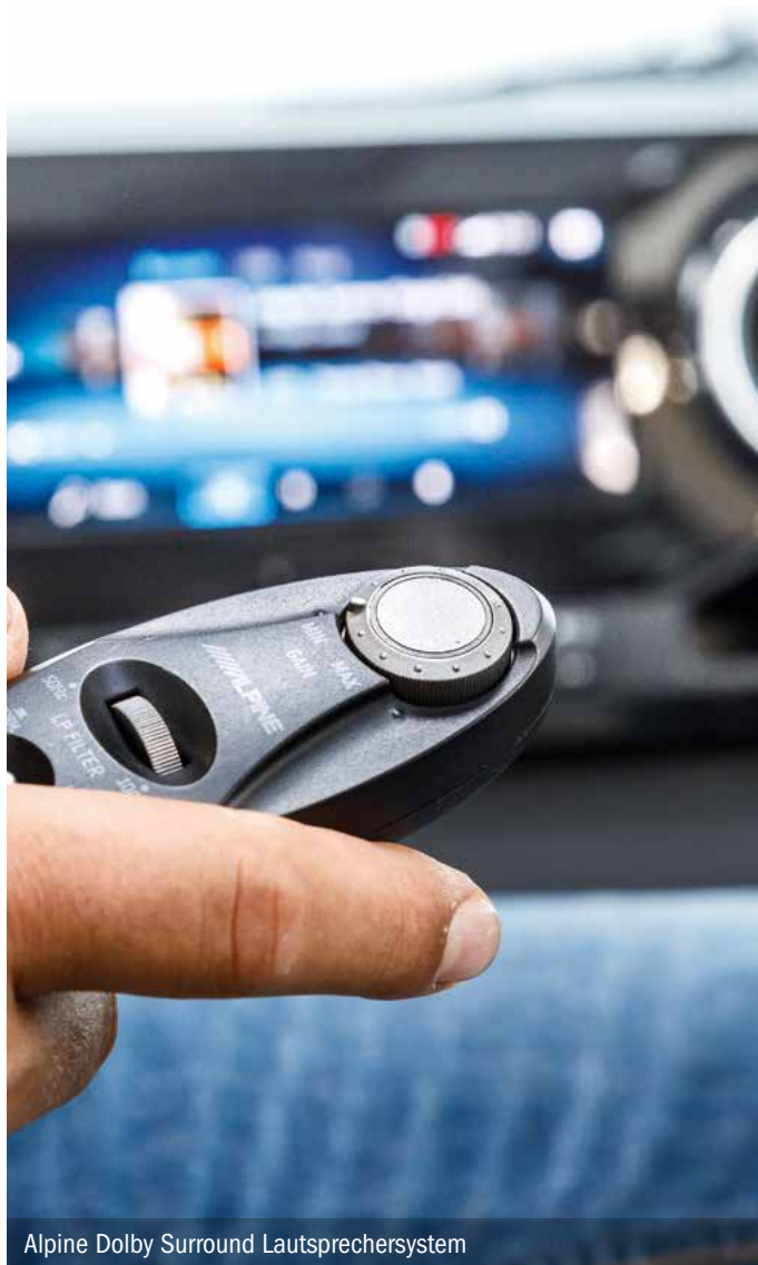
Alpine Dolby Surround Lautsprechersystem