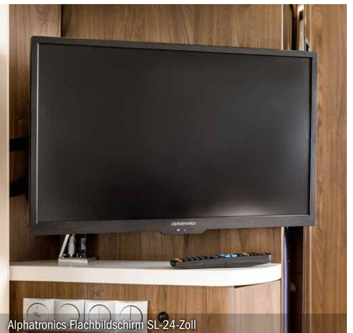
Alphatronics Flachbildschirm SL-24-Zoll