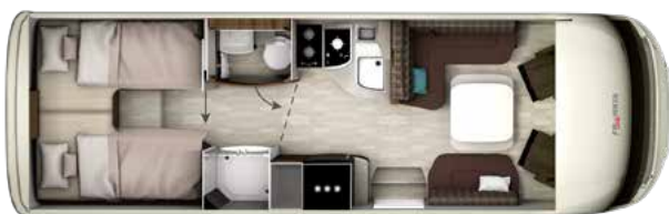
I 7900 GD PLATIN