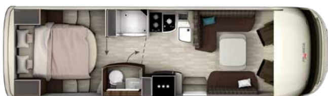
I 8400 QD PLATIN