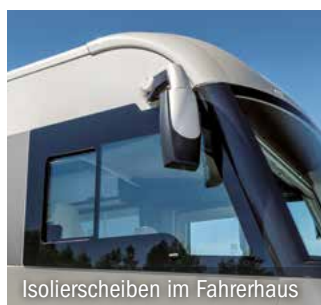
Isolierscheiben im Fahrerhaus