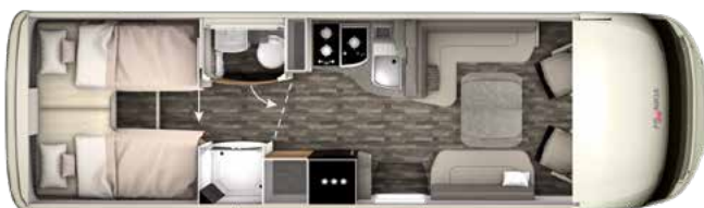
I 8400 GD PLATIN