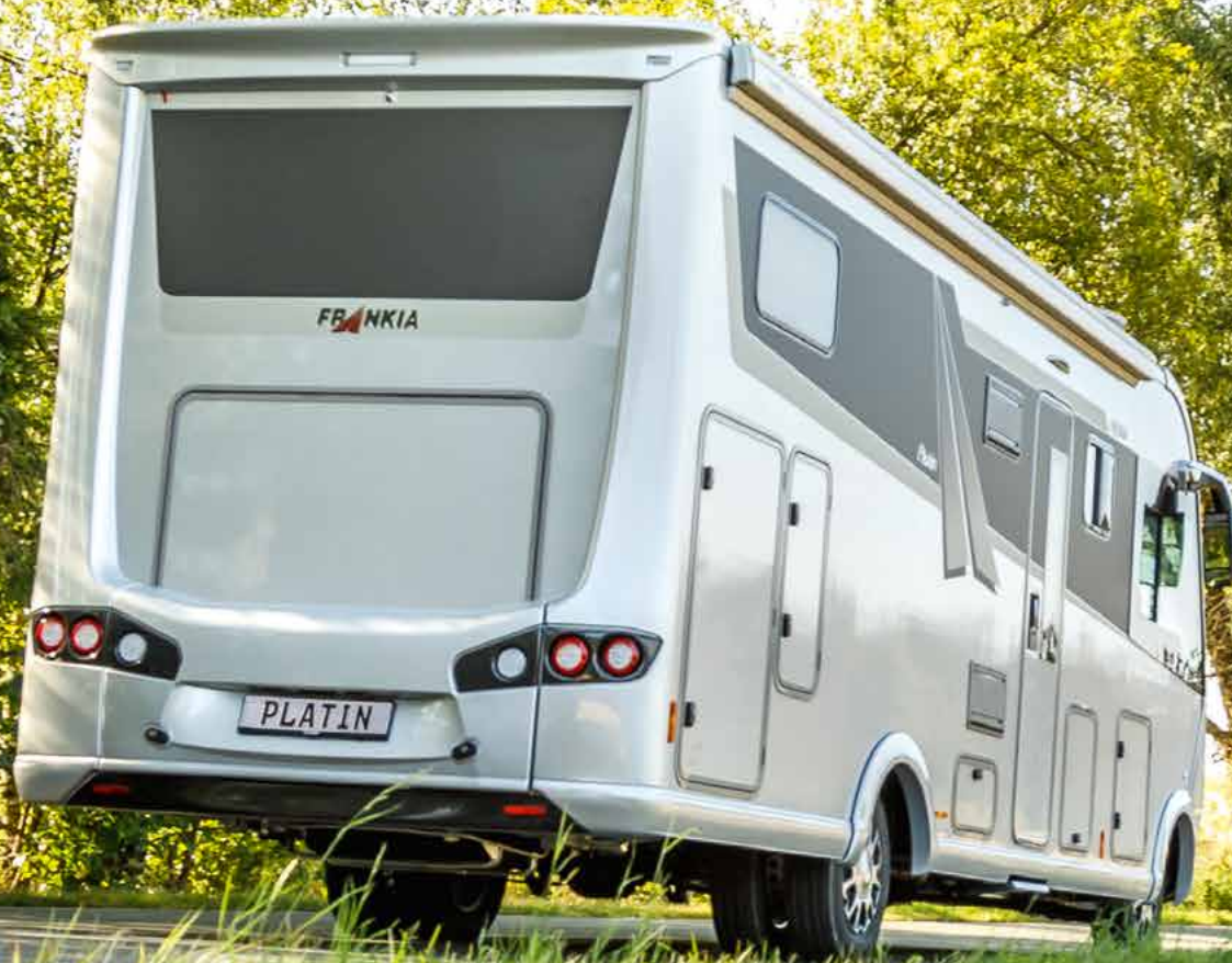
FRANKIA I 7900 GD PLATIN in Farbvariante Silver-Arrow