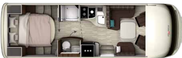
I 7900 QD PLATIN